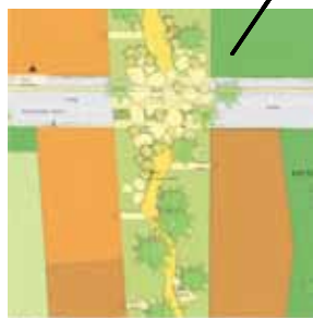
une sente piétonne accompagnée d'un maillage de venelles desservant les îlots d'habitat