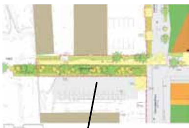
Liaison avec le parc urbain