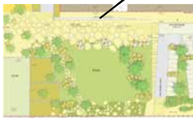
Une place centrale en façade de la rue Pasteur