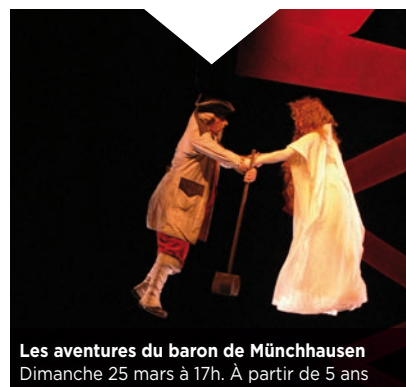
Les aventures du baron de Münchhausen Dimanche 25 mars à 17h. À partir de 5 ans