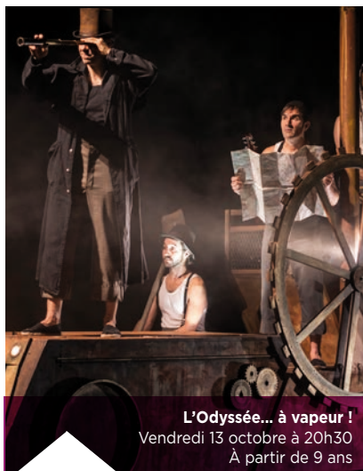
L'Odyssée... à vapeur ! Vendredi 13 octobre à 20h30 À partir de 9 ans