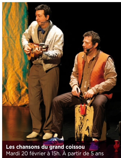
Les chansons du grand coïssou Mardi 20 février à 15h. À partir de 5 ans