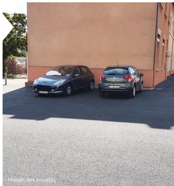
Maison des sociétés

Enfin, concernant l'Hôtel de Ville , l'accès à la toiture a été sécurisé. Les travaux d'accessibilité prendront fin très prochainement. Ils feront place à une salle du Conseil Municipal et un accueil de la mairie accessible à tous. Une borne sera à votre disposition afin de faciliter vos démarches administratives et de consulter divers documents.