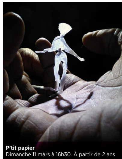
P'tit papier Dimanche 11 mars à 16h30. À partir de 2 ans